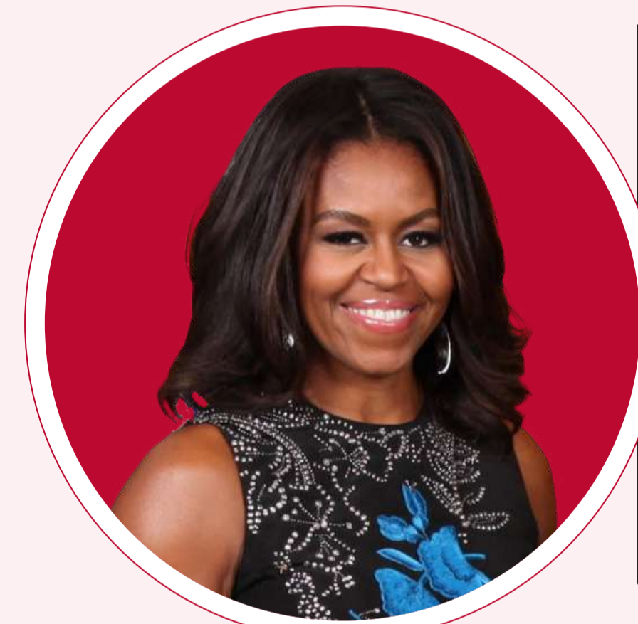
MICHELLE OBAMA Escritora e ex-primeira dama dos Estados Unidos

Freakonomics: O lado oculto e inesperado de tudo que nos afeta, Steven D. Levitt e Stephen J. Dubner SINOPSE: Esse livro tem o intuito de mudar o modo como pensamos o mundo. Aqui, a economia é aplicada no dia a dia, com uma linguagem fácil, para auxiliar as pessoas a resolverem os mais diversos problemas.