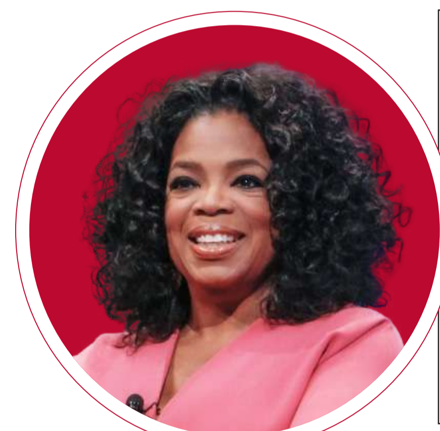
OPRAH WINFREY Apresentadora, jornalista e empresária

Vidas Secas, Graciliano Ramos SINOPSE: Lançado oficialmente em 1938, Vidas Secas retrata a vida de uma família de retirantes sertanejos obrigada a se deslocar de tempos em tempos para áreas menos castigadas pela seca. O pai, Fabiano, é acompanhado pela mulher, Sinha Vitória, dois filhos e Baleia, a cachorrinha da família cuja nome não poderia ser mais irônica, pois a falta de comida a fez muito magra.