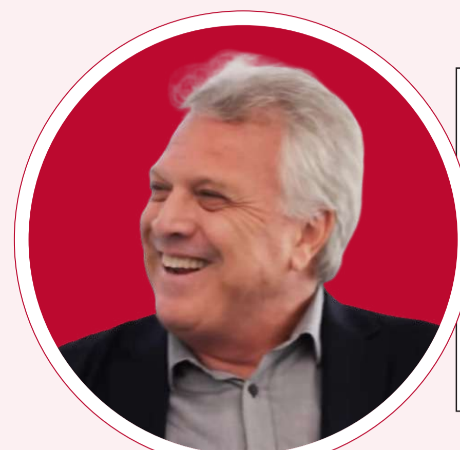
PEDRO BIAL Jornalista e apresentador

A Casa de Doces, Jennifer Egan (autora vencedora do Pulitzer de Ficção 2011) SINOPSE: Bix Bouton é um empresário de sucesso, conhecido por todos como um "semeador da tecnologia". Em 2020, Bix lança uma nova ferramenta: "Domine Seu Inconsciente" pode acessar todas as memórias do ser humano e permite compartilhá-las em troca do acesso às memórias de outras pessoas. Em uma teia fascinante, acompanhamos as consequências dessa tecnologia na vida de personagens cujo caminhos se cruzarão em diferentes momentos.