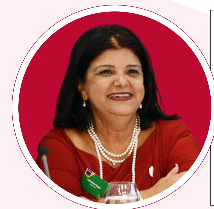
LUIZA HELENA TRAJANO Empresária, presidente do conselho de administração da rede Magazine Luiza

A Invenção da Solidão, Paul Auster SINOPSE: Um livro de memórias construído em forma de um "mosaico poético", onde o autor altera recordações pessoais, como a morte de seu pai, com comentários sobre literatura, pintura e filosofia.