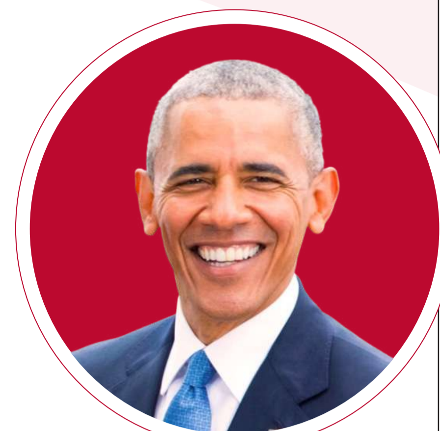
BARACK OBAMA 44ª presidente dos Estados Unidos (2009-2017)

Atualmente, os brasileiros alcançam a marca de cerca de quatro livros lidos por ano, enquanto os canadenses leem, em média, 12 livros no mesmo período. Esse ponto, que pode parecer desmotivador, deve, na verdade, servir como impulsionador de mais ações voltadas ao incentivo da leitura, como o #BookTok, a divulgação de conteúdos literários no Tik Tok, e os influenciadores chamados de BookTubers, que dão dicas e avaliam livros em vídeos mais longos no YouTube. Para entrar nesse movimento e mostrar o poder da leitura em nossas jornadas, listamos os livros preferidos de grandes personalidades do mundo, conhecidas por suas trajetórias ímpares, e indicações dos executivos e especialistas do Grupo Bradesco Seguros.