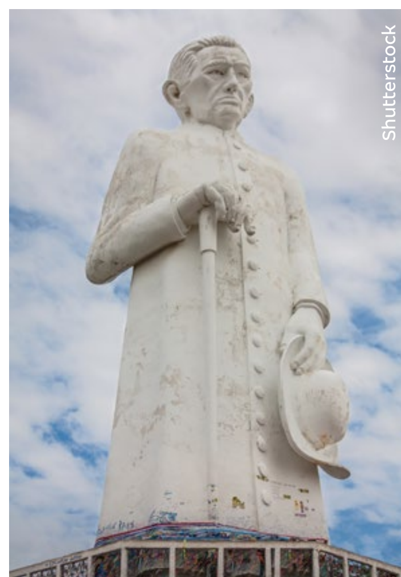
Estátua de Padre Cícero – Juazeiro do Norte

Fortaleza - Labpasteur (Grupo DASA) - Unimagem (Grupo DASA)