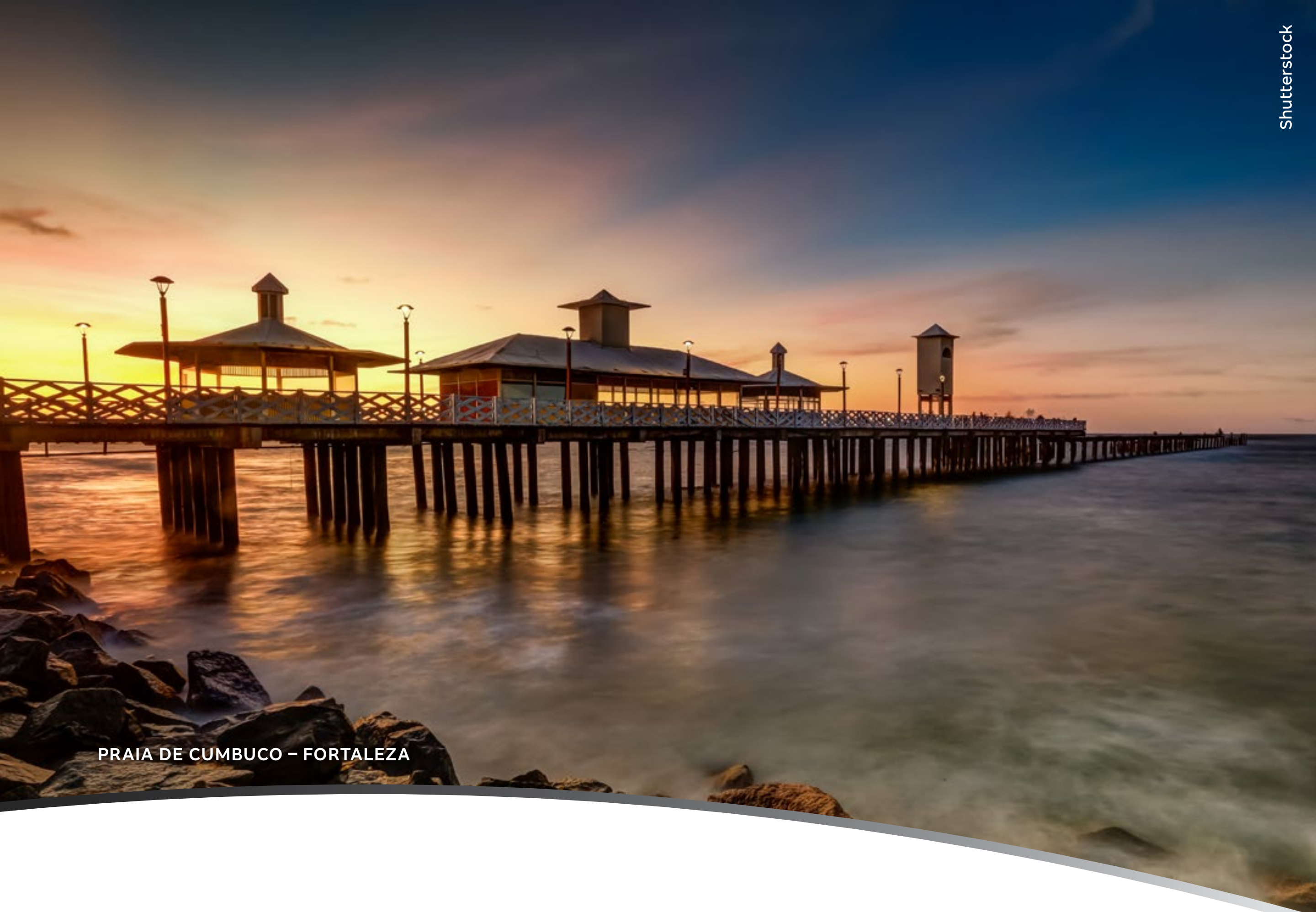
PRAIA DE CUMBUCO – FORTALEZA

Fortaleza tem encantos urbanos, praias lindas e um dos maiores parques aquáticos da América Latina. A religiosidade de Juazeiro do Norte, com seus romeiros, e a autenticidade deslumbrante de Jericoacoara traduzem uma natureza e uma cultura cheias de cartões-postais. Tudo isso é o Ceará, com seu povo hospitaleiro, uma economia que não para de crescer e ótimos índices de desenvolvimento humano e de qualidade de vida.